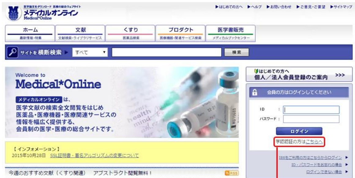
図1 ログインの実行

インターネットエクスプローラ等の Web ブラウザを使って、メディカルオンラインのホームページへアクセスし、画面右上の「学認認証の方は こちらへ 」をクリックします。