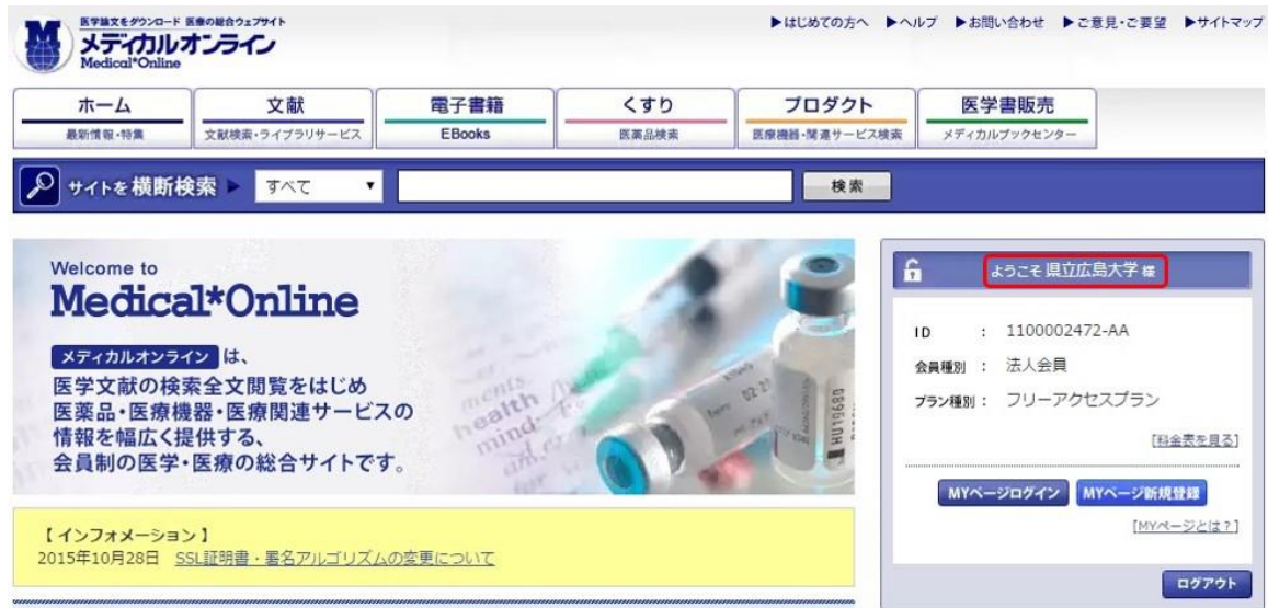
図4 ポータルサイトの表示画面

認証が完了すると、メディカルオンラインのポータルサイトが起動し、画面右側に「ようこそ 県立広島大学 様」と表示されます。