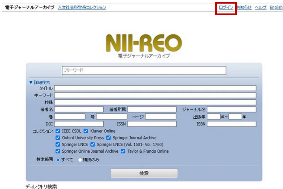
図1 ログインの実行

Web ブラウザを使って、NII REO(電子ジャーナルアーカイブ)のホームページへアクセスし、画面右上の「ログイン」をクリックします。