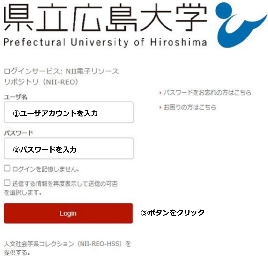
図3 学認へのログイン画面

県立広島大学の学認へのログイン画面が表示されますので、学内のユーザアカウント及びパスワードを入力し、ログインします。